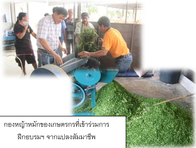
กองหญ้าหมักของเกษตรกรที่เข้าร่วมการฝึกอบรมฯ จากแปลงสัมมาชีพ